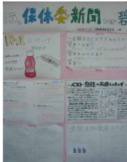
【先輩の健康を願って作りました】

2、3月は受検の季節。3年生の中には、すでに進学先が決定し生徒もいますが、多くは3月の公立一般受検を目指し、ラストスパートの真っ最中です。そんな受験生にとって、一番重要と言っても過言ではないのが体調管理。附属長岡中では、保健体育委員会の1・2年生が先輩の体調管理に一役買おうと壁新聞を作成しました。「風邪予防」から「寒さ対策」、「食事のポイント」など、受験生に必要な情報が満載です。先輩を応援する後輩の想いは、必ず先輩の力になります！3年生もそんな応援の声を力に替え、本番で力のすべてを発揮してください！