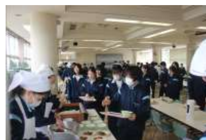
【食堂での配膳も初！】

名前の「みずき」は3年生の学年ニックネーム。その名を冠し、「3年生に夢のような給食の時間をプレゼントしよう！」と企画されました。例年行われていたリクエスト給食（3年生が給食のメニューを選べます！）に加え、コロナウイルス禍で給食に使用されていなかった食堂を4年ぶりに使用！「3年間共に過ごした仲間と、全員で給食を楽しんでほしい」という1，2年生給食委員の思いと、3年生の仲間との交流を楽しむ和やかな空気を感じられたひと時でした。