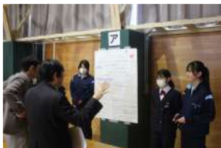
【あるグループのステークホルダー（SH）との交流】

SH：土手にポールを立て、ライトアップするアイデアは面白いです。しかし、電気代だけでなく、ポールを立てるにもコストがかかることも知っておくとよいです。また、現在土手にポールを立てていないのは、整備などのために邪魔になることがあるからというのもあるんですよ。