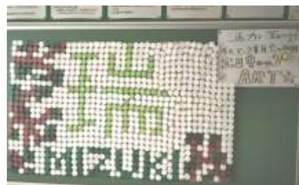
【キャップ1つ1つに感謝を込めて】

1・2年生の、3年生に対する感謝の思いを込めて、ペットボトルキャップで「瑞」の文字を描きました！保護者の皆様もご来校の際にご覧ください！