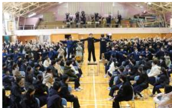
【感謝と激励の思いを込めて】