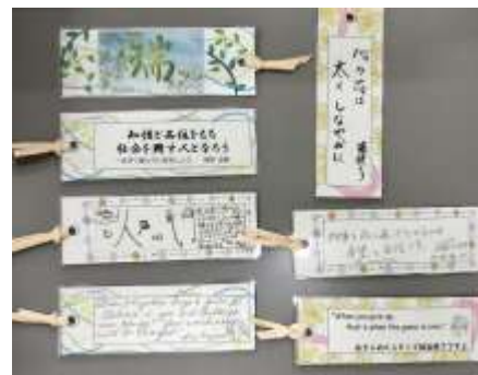
【3年生の先生方のメッセージ入り】

3年生へ、感謝の気持ちを込めて「しおり」を送りました。ただの「しおり」ではありません。ご覧の通り、そのデザインは附属長岡中ならではの。きっと3年生も、大切に使ってくれますよ。