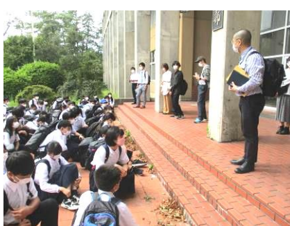
【新潟大学教育学部前】