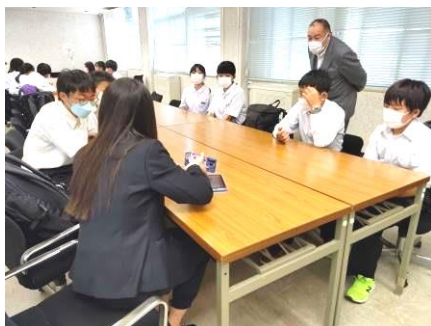
【新潟大学大講義室】

また、地域軸として、新潟市内（五十嵐、内野、古町）のフィールドワークを行いました。これらを通して生徒は視野を広げ、自らのキャリアビジョンを振り返り、キャリア軸や地域軸の学びに向かっていきます。