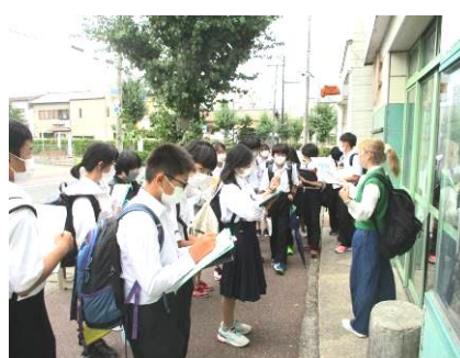
【内野地区フィールドワーク】