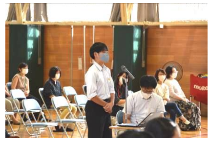
【講演後の活発な質疑】