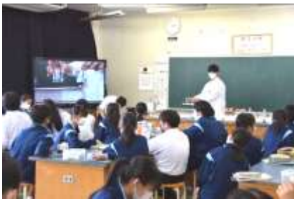
【教育実習生との授業の様子】

新潟大学は4週間、その他の学生は3週間の教育実習が終了しました。その他の学生は附属長岡中学校の卒業生であり、先輩としても生徒と関わってもらいました。生徒たちは職員に比べて年齢の近い教育実習生と一緒に、勉強をしたり、語り合ったりと充実した4週間で過ごしていました。