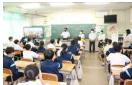
【教育実習生とのお別れ会の様子】